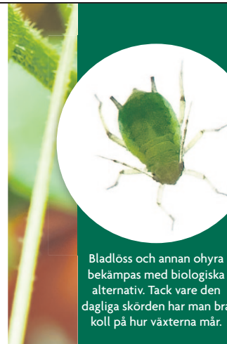
Bladlöss och annan ohyra bekämpas med biologiska alternativ. Tack vare den dagliga skörden har man bra koll på hur växterna mår.